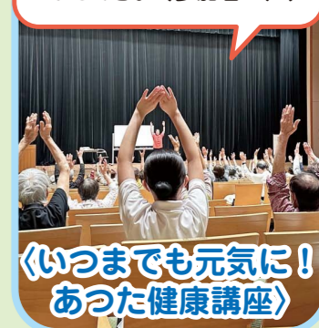
〈いつまでも元気に! あつた健康講座〉