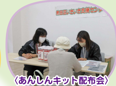
〈あんしんキット配布会〉