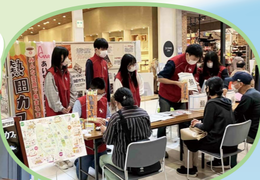
〈認知症サポーター養成講座〉