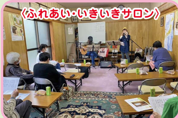
〈ふれあい・いきいきサロン〉