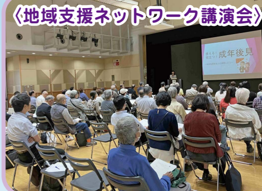
〈地域支援ネットワーク講演会〉