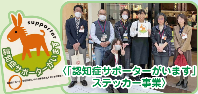
「認知症サポーターがいます」ステッカー事業